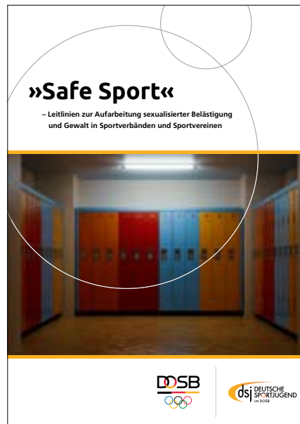
Safe Sport – Leitlinien zur Aufarbeitung sexualisierter Belästigung und Gewalt in Sportverbänden und Sportvereinen