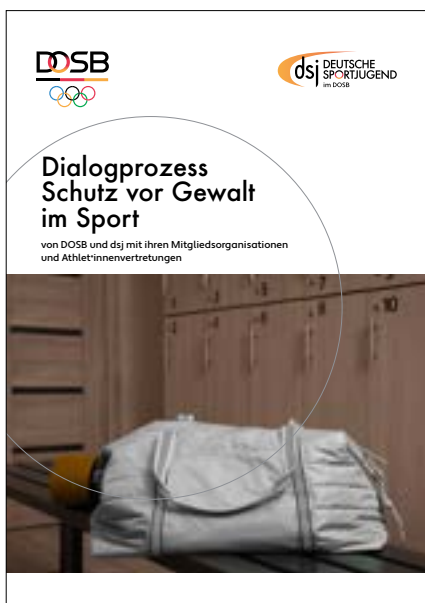
Dialogprozess Schutz vor Gewalt im Sport