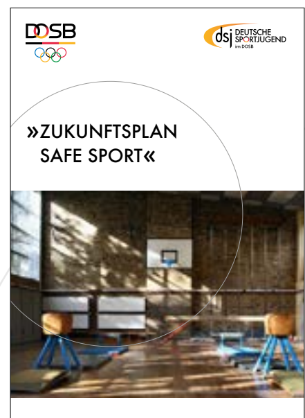
Zukunftsplan Safe Sport