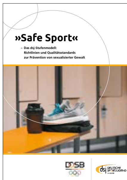
Safe Sport - Das dsj-Stufenmodell