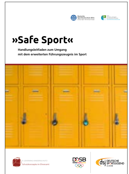
Safe Sport – Handlungsleitfaden zum Umgang mit dem erweiterten Führungszeugnis im Sport