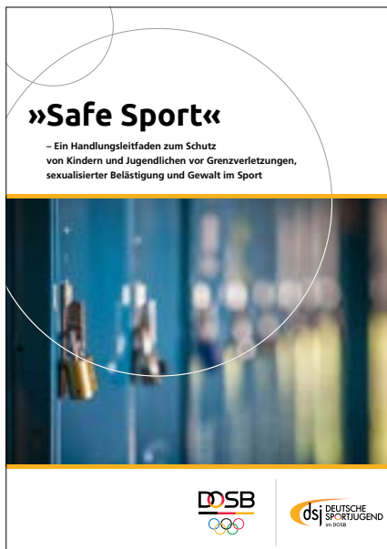
Safe Sport – Ein Handlungsleitfaden zum Schutz von Kindern und Jugendlichen vor Grenzverletzungen, sexualisierter Belästigung und Gewalt im Sport